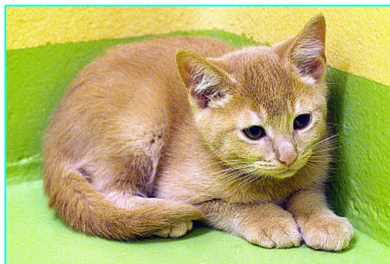
Chaton abattu, en début d'évolution de la maladie sous sa forme classique. Noter la prostration dans un coin de la pièce.

La vaccination permet de prévenir les signes cliniques et la mortalité, et participe à la diminution de la fréquence de l'affection dans la population féline. Cependant, il ne faut pas l'oublier : le typhus fait toujours des ravages en collectivité, notamment en refuge. Quelques cas sont recensés en chatterie.