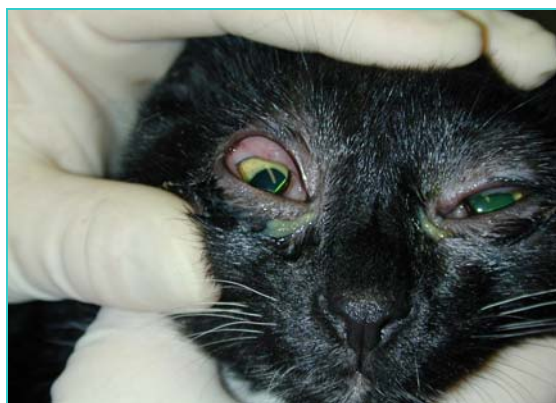
Conjonctivite unilatérale due à Chlamydomydia felis.

Cette maladie est due à une bactérie*, Chlamydomydia felis . Elle provoque surtout des conjonctivites* qui peuvent récidiver. La transmission se fait principalement par contact étroit, « nez à nez », avec un chat excréteur une quantité importante de bactérie dans ses larmes ou ses sécrétions nasales.